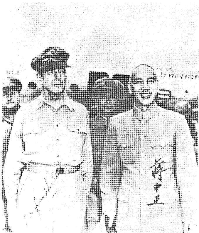
แม็กอาเธอร์ และเจียงไคเช็ค ยอดนักปลุกผีของโลก