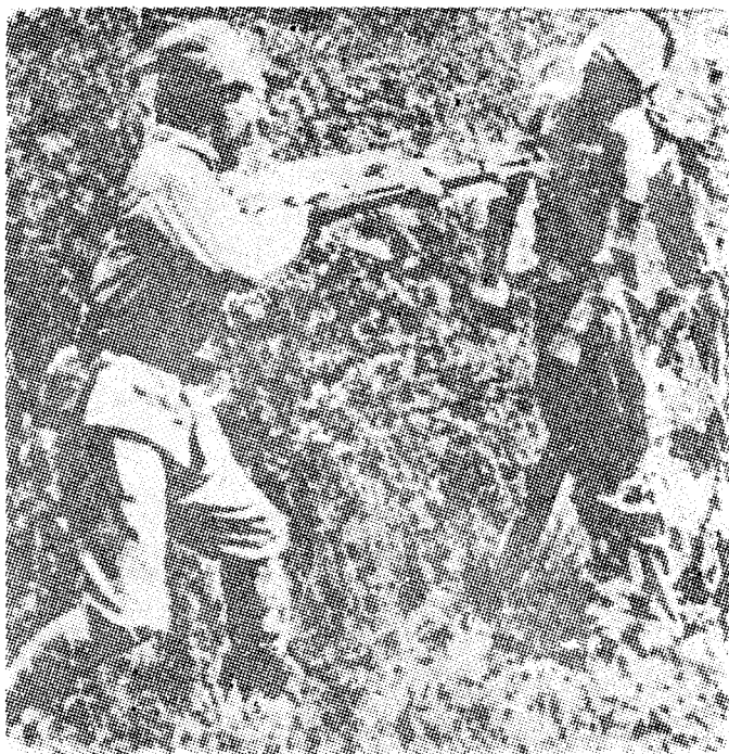
การุณกรรมของจักรวรรดินิยมญี่ปุ่นในประเทศจีน ตัวอย่างของสันดานจักรวรรดินิยมทั่วโลก