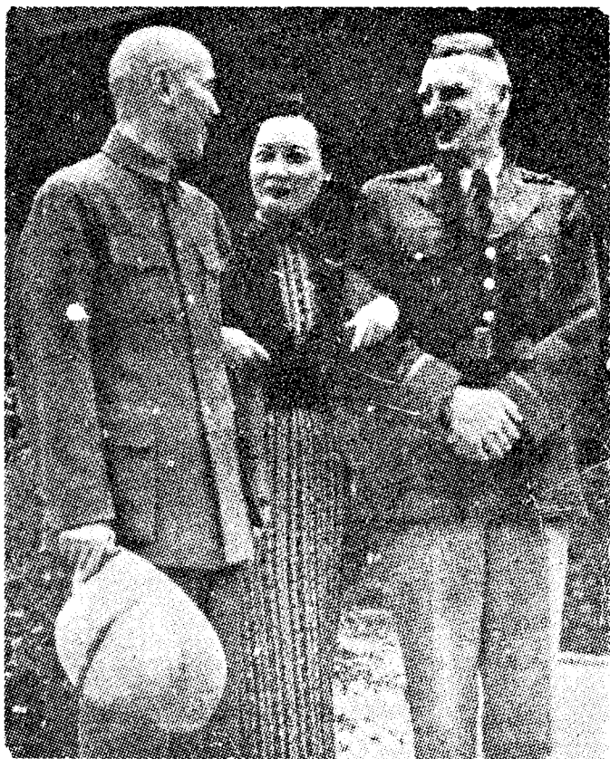
การสร้างความสัมพันธ์ระหว่างจักรวรรดินิยม และนายทุนขุนศึกเป็นปัจจัยสำคัญยิ่ง ในการปลุกผีคอมมิวนิสต์