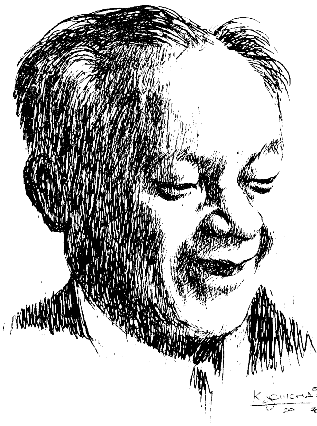
ดร. เปรม ติณสูลานนท์