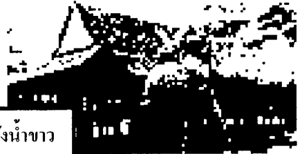
ภาพชาว-ดำ ศาลาหลังเก่าวัดวังน้ำขาว

นี่ อย่างน้อยก็เกมของข้าพเจ้าเอง ข้าพเจ้าทำอะไรอย่างอื่นไม่ได้ นอกจากตะเบ็งเสียงขึ้นว่า "ยอมแพ้อัดไปเถิด" หวังว่าเสียงที่ข้าพเจ้าตะเบ็งจะได้ยินไปถึงเพื่อนข้าพเจ้าและทำให้เขามีเวลานี้ไป" ( ดิเรก , หน้า 413 )