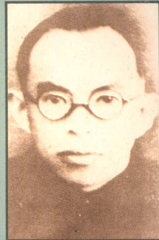
จำกัด พลาญกูร