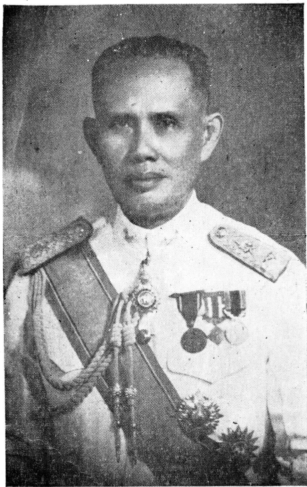
พลโท ปลด ปลดปรักษ์ พิบูลภานุวัจน์