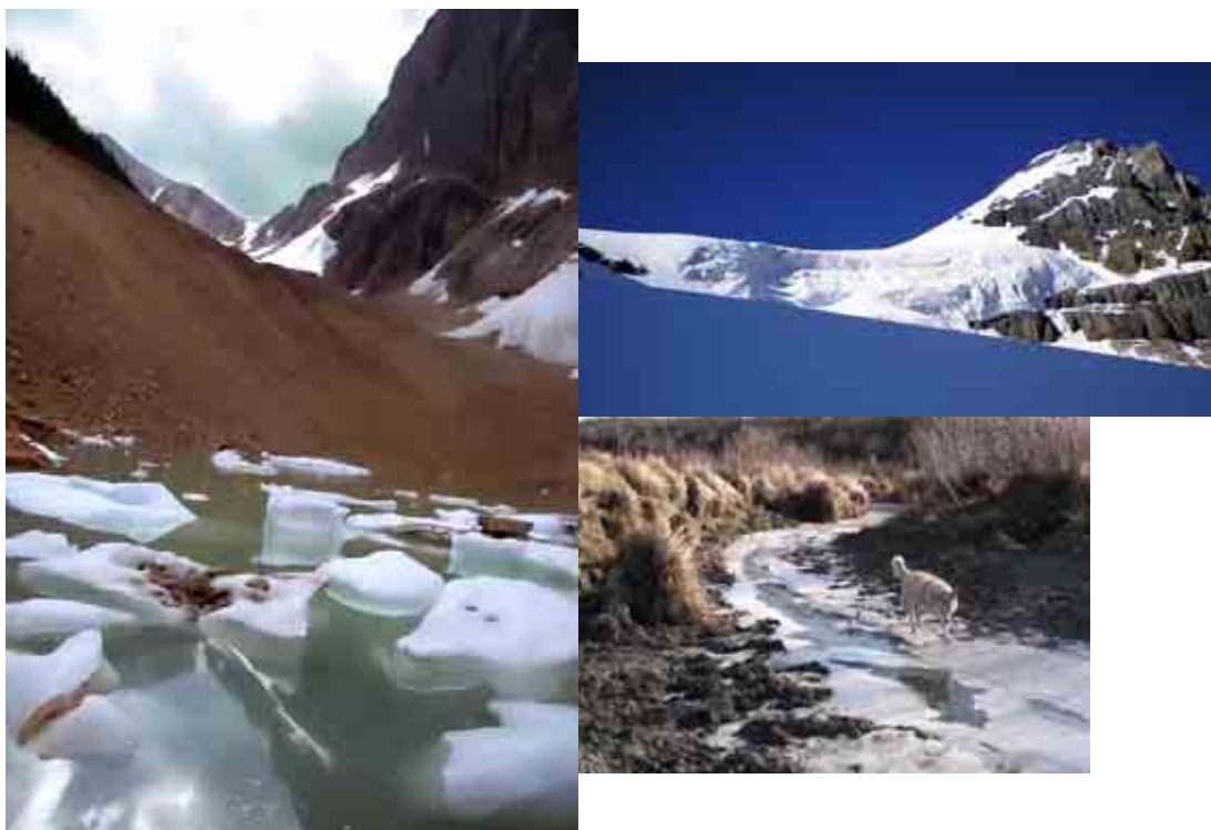
ภาพลักษณะภูมิอากาศทางภาคกลางตอนใต้ ของประเทศแคนาดาที่ ลักษณะภูมิอากาศจะหนาวเย็นรุนแรงในฤดูหนาว