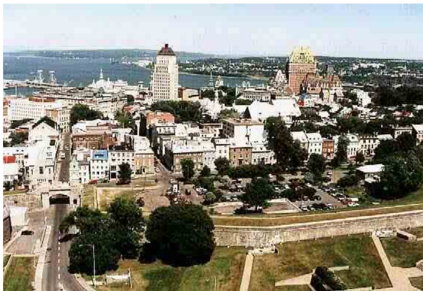
ภาพเมืองควิเบค ในมณฑลควิเบค จากภาพเป็นแนวกำแพงป้องกันเมืองเก่า ซึ่งประชากรส่วนใหญ่ในเมืองนี้ใช้ภาษาฝรั่งเศสเป็นหลัก

ต่อมาภายหลัง ช่วงหลังจากสงครามโลกครั้งที่ 2 กลุ่มประชากรจึงเป็นผู้อพยพจากกลุ่มประเทศต่างๆ ในทวีปยุโรป และในช่วงท้ายสุดในศตวรรษที่ 20 ผู้อพยพกลุ่มใหม่จะมาจากประเทศในแถบทวีปเอเชียเป็นหลัก ดังจะเห็นได้จากในเมืองขนาดใหญ่ เช่น แวนคูเวอร์ และโตรอนโต จัดว่าเป็นเมืองที่มีผู้อพยพย้ายถิ่นจำนวนมาก และเป็นชนกลุ่มน้อยที่ชัดเจนคือ มีจำนวนถึง 1 ใน 3 ของประชากรในเมืองนั้น นอกจากนี้ยังพบว่าใน 2 เมืองนี้ มีนักเรียน 1 ใน 5 คนเป็นผู้อพยพกลุ่มใหม่ โดยที่เมืองแวนคูเวอร์มีประชากรถึงร้อยละ 61 พูดภาษาอื่นที่ไม่ใช่ภาษาอังกฤษ หรือ ภาษาฝรั่งเศส และใช้ภาษาอื่นในครอบครัว สำหรับเมืองโตรอนโตนั้น อาจกล่าวได้ว่าเป็นเมืองที่มีความหลากหลายทางวัฒนธรรมสูงที่สุดในโลก เพราะพบว่ามีคนกลุ่มน้อยที่มีความแตกต่างทางวัฒนธรรม หรือ กลุ่มชาติพันธุ์รวมแล้วถึง 80 กลุ่ม และมีการใช้ภาษาต่างๆ กว่า 100 ภาษา