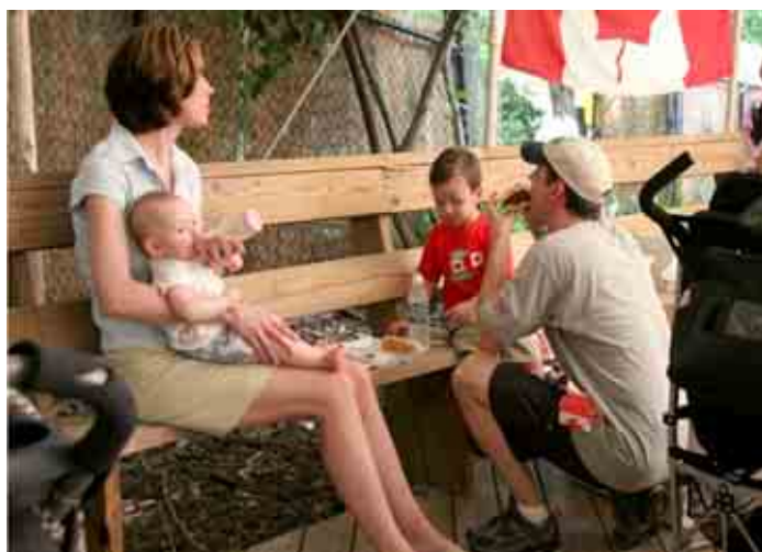
ภาพ บทบาทของสถาบันครอบครัวที่มีหน้าที่ในการเลี้ยงดู ให้ความรัก ความอบอุ่น ความปลอดภัย ตลอดจนการขัดเกลาลักษณะนิสัยที่พึงประสงค์ของสังคมแก่บุตรหลานของตน

แคนาดาไม่ได้วิ่งตามกระแสการพัฒนาของโลก เช่นเดียวกับประเทศอื่นๆ ที่พัฒนาแล้ว ที่มีสถาบันอื่นมาทดแทนบทบาทและความสำคัญของสถาบันครอบครัว แต่แคนาดายังคงให้ความสำคัญต่อบทบาทของสถาบันครอบครัว และบทบาทของพ่อ-แม่ในการอบรมและเลี้ยงดูบุตรหลานของตน โดยการส่งเสริมให้พ่อ-แม่มีความภาคภูมิใจต่อบทบาทในการพัฒนามุตรหลานของตนเองและของสมาชิกในสังคม เช่น การให้ พ่อ-แม่ได้ลาพักเพื่อเลี้ยงดูบุตรในช่วงขวบปีแรก หรือการลาพักเพื่อดูแลบุตรเมื่อมีภาวะการเจ็บป่วย ซึ่งทำให้ในช่วงแรกของชีวิตในวัยเด็กได้รับความปลอดภัย ซึ่งเป็นสถานการณ์ในอุดมคติของการดูแล และอบรมเลี้ยงดูเด็กในเยาว์วัย