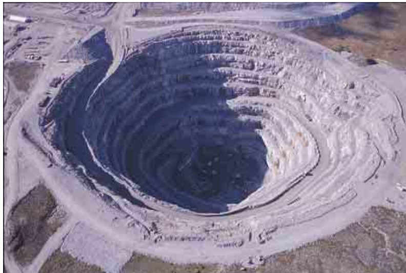
ภาพภูมิประเทศของเขตปกครองอิสระนอร์คเวสต์ ซึ่งมีอุตสาหกรรมที่สำคัญคือการทำเหมืองแร่เพชร