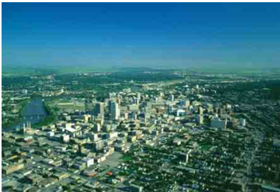
ภาพภูมิประเทศของมลรัฐมานิโตบา ซึ่งมีลักษณะภูมิประเทศเป็นที่ราบ เป็นที่ตั้งของเมืองและโรงงานอุตสาหกรรมต่างๆ

ทางด้านตะวันออก ซึ่งประกอบด้วย มลรัฐออนตาริโอ คิวเบค โนวาสโกเชีย นิวบรันสวิก ปรินซ์เอ็ดเวิร์ดไอส์แลนด์ นิวฟาวด์แลนด์และลาบราดอร์ จะมีลักษณะกิจกรรมทางเศรษฐกิจที่ค่อนข้างหลากหลาย พื้นที่ส่วนใหญ่ของมลรัฐออนตาริโอและ คิวเบค เป็นพื้นที่ราบลุ่มที่ต่อเนื่องมาจากมลรัฐมานิโตบา จะมีลักษณะภูมิอากาศที่ลดความรุนแรงลง และจากการมีทะเลสาบขนาดใหญ่ทั้ง 5 ที่เป็นเขตแดนระหว่างแคนาดากับสหรัฐอเมริกา ทำให้พื้นที่บริเวณนี้เป็นพื้นที่ที่เหมาะสมในการทำเกษตรและเป็นแหล่งที่อยู่อาศัย ประชากรของประเทศจึงอาศัยอยู่กันอย่างหนาแน่นในบริเวณดังกล่าว ลักษณะกิจกรรมทางเศรษฐกิจที่สำคัญได้แก่ การทำเกษตรกรรม การทำฟาร์มเลี้ยงสัตว์ โดยเฉพาะสัตว์ปีกเพื่อผลิตเนื้อสัตว์สำหรับการบริโภคภายในประเทศ และส่งออกยังต่างประเทศ สำหรับด้านกิจกรรมได้แก่ การปลูกข้าวโพด ผัก ผลไม้ การทำเหมืองแร่ ได้แก่ ทอง นิกเกิล ทองแดง ยูเรเนียม และสังกะสี และที่สำคัญ คือเป็นแหล่งโรงงานอุตสาหกรรมรถยนต์ โดยเฉพาะในมลรัฐออนตาริโอ