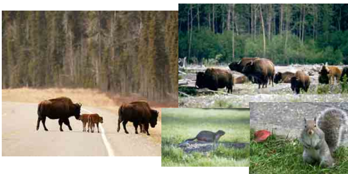
ภาพควายไบซัน (Bison) ภายในอุทยานแห่งชาติที่มีพื้นที่ติดกับชุมชน และกระรอกดินในสวนสาธารณะของเมืองใหญ่ ในประเทศแคนาดาที่สามารถดำรงชีวิตได้อย่างเป็นอิสระโดยไม่ถูกรบกวน

การที่คนแคนาดาเติบโตท่ามกลางสิ่งแวดล้อมทางธรรมชาติที่มีความสวยงาม และได้รับการดูแลใส่ใจเป็นอย่างดี ส่งผลให้เกิดคุณลักษณะการเป็นบุคคลที่ให้ความสำคัญและใส่ใจต่อสิ่งแวดล้อม โดยมีธรรมชาติที่สวยงามของประเทศเป็นเครื่องหล่อหลอมจิตใจให้คนแคนาดามีจิตใจที่รักและห่วงใยสิ่งแวดล้อม คนแคนาดาจะให้ความร่วมมือในความพยายามที่จะไม่กระทำการใดที่เป็นการทำลายธรรมชาติและสิ่งแวดล้อมทั้งทางตรงและทางอ้อม โดยพบว่า ในอุทยานแห่งชาติ หรือ เขตรักษาพันธุ์สัตว์ป่าและพันธุ์พืช ที่ไม่พบปัญหาการจับจองและถือกรรมสิทธิ์ครอบครองพื้นที่อย่างผิดกฎหมาย จะไม่พบปัญหาการบุกรุกพื้นที่อุทยาน หรือการเก็บผลผลิตจากป่าที่ไม่ชอบด้วยกฎหมาย ในส่วนของการสร้างที่อยู่อาศัยในเขตอุทยานแห่งชาติ แคนาดาไม่อนุญาตให้ตัด หรือ การโค่นต้นไม้เพื่อทำเป็นพื้นที่ในการปลูกสร้างที่อยู่อาศัย แต่การจะปลูกสร้างที่อยู่อาศัยต้องเลือกขนาดพื้นที่ตามความจำเป็นของประโยชน์ใช้สอย และเลือกทำเลที่มีขนาดของพื้นที่ว่างตามต้องการโดยไม่รบกวนธรรมชาติ ในกรณีที่เป็นที่จะต้องมีการตัดต้นไม้ บุคคลต้องทำเรื่องไปยังหน่วยงานที่เกี่ยวข้องและได้รับอนุญาตเสียก่อน โดยส่วนใหญ่ต้นไม้ที่ได้รับการอนุญาตให้ตัดจะเป็นต้นไม้ที่ตายแล้วเท่านั้น