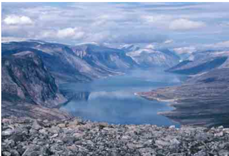
ภาพลักษณะภูมิอากาศของเขตปกครองอิสระ นูนาวุต ซึ่งมีพื้นที่อยู่ทางตอนเหนือของประเทศ แถบบริเวณขั้วโลกเหนือ ทำให้มีอากาศหนาวเย็นรุนแรงตลอดทั้งปี

จากตำแหน่งที่ตั้งของประเทศแคนาดาที่อยู่บริเวณขั้วโลกเหนือ ในเขตอาร์คติก ทำให้แคนาดามีอากาศที่ค่อนข้างรุนแรง และหนาวเย็นเกือบตลอดทั้งปี มีฤดูหนาวที่ยาวนานและหนาวจัด มีช่วงฤดูร้อนค่อนข้างสั้น มี 4 ฤดูที่ภูมิอากาศมีความแตกต่างกันอย่างชัดเจน คือ ฤดูหนาว ฤดูใบไม้ผลิ ฤดูร้อน และฤดูใบไม้ร่วง นอกจากนี้ อากาศในแต่ละภูมิภาคยังมีความแตกต่างกันอย่างชัดเจน เช่น ทางตะวันตกของประเทศ ในฤดูร้อนมีอากาศที่สบาย ในฤดูหนาวมีฝนตกเกือบตลอดเวลา ส่วนทางภาคกลางตอนใต้ แถบทุ่งหญ้าแพรรี่ ในฤดูหนาวอากาศจะหนาวจัดอุณหภูมิลดลงถึง 40 องศาเซลเซียส ได้จุดเยือกแข็งหรือต่ำกว่านั้น ส่วนฤดูร้อนแม้จะเป็นเวลาสั้นๆ แต่อากาศร้อนจัดอุณหภูมิสูงถึง 30 องศาเซลเซียส เป็นต้น