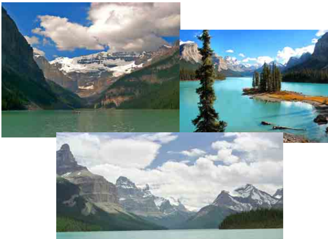
ภาพภูมิประเทศของมลรัฐอัลเบอร์ตาประกอบด้วยเทือกเขาร็อกกี ธารน้ำแข็ง และป่าสน

ในทางกลับกันอากาศก็ได้รับอิทธิพลจากธรรมชาติ ด้วยลักษณะของภูมิประเทศ และภูมิอากาศดังกล่าว ส่งผลให้สิ่งแวดล้อมทางธรรมชาติของประเทศมีความประหลาดมาก ดังนั้น ประเทศแคนาดาจึงให้ความสำคัญต่อระบบนิเวศและสิ่งแวดล้อมทางธรรมชาติ เป็นอย่างมาก มีการกำหนดเขตอุทยานถึง 39 แห่งทั่วประเทศ นอกจากนี้แต่ละมลรัฐและ เขตการปกครองยังมีการกำหนดเขตอุทยาน เขตสัตว์ป่า และเขตสงวนระบบนิเวศและ ทรัพยากรธรรมชาติ อีกกว่า 200 แห่งทั่วประเทศ