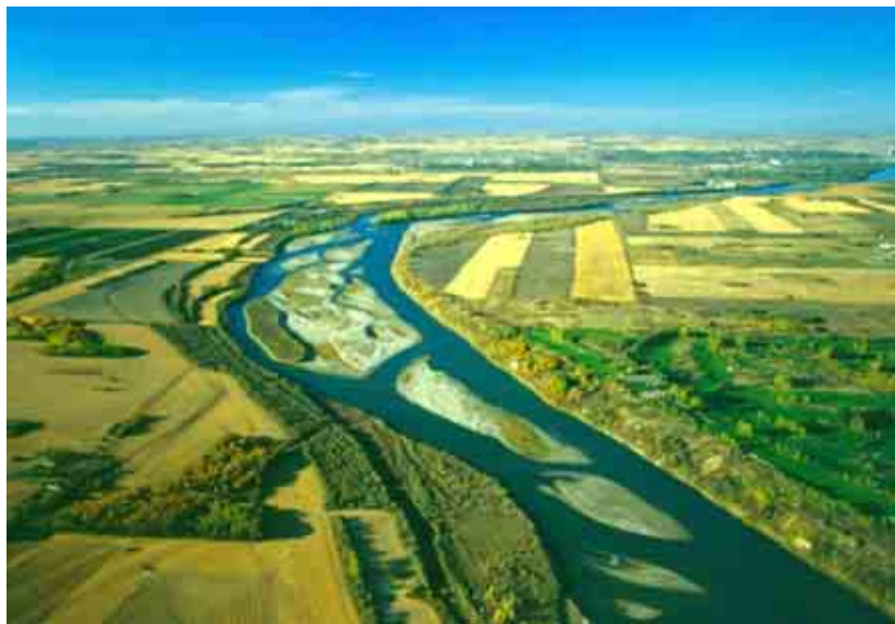
ภาพภูมิประเทศมลรัฐซัสคาตเชวาน ซึ่งพื้นที่ส่วนใหญ่ยังเป็นทุ่งหญ้าแพรรี เศรษฐกิจที่สำคัญคือ การเกษตรกรรม

ถัดจากมลรัฐอัลเบอร์ตา คือ มลรัฐซัสคาตเชวาน พื้นที่ส่วนใหญ่ยังเป็นทุ่งหญ้าแพรรีที่ต่อเนื่องมาจากมลรัฐอัลเบอร์ตา ดังนั้น กิจกรรมทางเศรษฐกิจของมลรัฐนี้จึงเป็นผลผลิตด้านเกษตรกรรม ประเภท ข้าวสาลี ป่าไม้ ประเภท ไม้เนื้ออ่อน นอกจากนี้ ยังเป็นแหล่งของอุตสาหกรรมปิโตรเคมี และก๊าซธรรมชาติ อุตสาหกรรมเหมืองแร่ประเภท ยูเรเนียม ถ่านหิน รวมทั้งเป็นแหล่งอุตสาหกรรมการก่อสร้าง และการท่องเที่ยวที่สำคัญของประเทศ