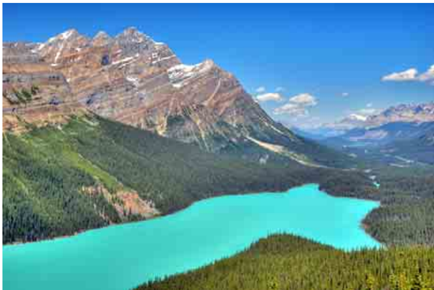
ภาพภูมิประเทศของมลรัฐอัลเบอร์ตาซึ่งพื้นที่ส่วนหนึ่งเป็นปลายสุดของเทือกเขาร็อกกี ประกอบด้วยทรัพยากรป่าไม้ ประเภทไม้สน ไม้ผลัดใบ