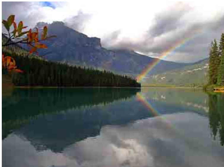
ภาพภูมิประเทศของมลรัฐบริติชโคลัมเบีย ที่อุดมไปด้วยทรัพยากรธรรมชาติที่สำคัญคือป่าไม้ประเภท ป่าสน ทำให้เกิดอุตสาหกรรมโรงงานเยื่อกระดาษและการแปรรูปไม้