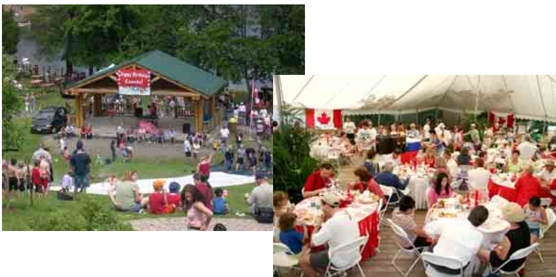
ภาพศูนย์กิจกรรมชุมชน(Community center) มีการจัดกิจกรรมต่างๆ ที่เป็นการเสริมคุณค่าของบุคคล และส่งเสริมความสัมพันธ์ระหว่างสมาชิกของชุมชน

ในส่วนของสังคมจะพบว่า ทุกชุมชนจะมีศูนย์กิจกรรมชุมชน(Community center) ที่ดำเนินการโดยสมาชิกของชุมชนนั้นๆ โดยมีรัฐบาลท้องถิ่นให้การสนับสนุน การดำเนินงานต่างๆ รวมทั้งอาจสนับสนุนงบประมาณบางส่วนให้ ซึ่งศูนย์กิจกรรมชุมชนเหล่านี้มีการดำเนินกิจกรรมต่างๆ ให้กับคนทุกกลุ่มอายุ ตั้งแต่เด็ก เยาวชน ถึงผู้ใหญ่ ตัวอย่างเช่น กิจกรรมสันทนาการต่างๆ กิจกรรมกีฬา กิจกรรมส่งเสริมสุขภาพ กิจกรรมวันสำคัญ ซึ่งผู้ทำงานให้กับศูนย์เหล่านี้จะอยู่ในรูปของอาสาสมัคร การร่วมกิจกรรมเหล่านี้ถือเป็นการเสริมคุณค่าของบุคคล และส่งเสริมความสัมพันธ์ระหว่างสมาชิกของชุมชน