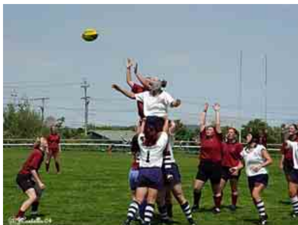
ภาพการแข่งขันกีฬารักบี้หญิงในประเทศแคนาดา ที่แสดงถึงความเสมอภาค และเท่าเทียมกันระหว่างหญิงและชาย

นอกจากนี้ ในด้านกีฬาทุกประเภท ทั้งหญิงและชายสามารถเล่นได้เหมือนกันหมด ไม่มีการจำกัดเพศ อีกทั้งกีฬาที่มีการเล่นเป็นทีม เช่น ฟุตบอล ผู้หญิงและผู้ชายสามารถเป็นนักกีฬาอยู่ในทีมเดียวกันได้ หรือ กีฬารักบี้ซึ่งเดิมเป็นกีฬาของผู้ชายเท่านั้น แต่ในแคนาดานั้นพบว่า มีผู้หญิงที่เล่นกีฬาประเภทนี้เป็นจำนวนมาก