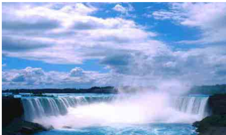
ภาพน้ำตกในแองการ่า สถานที่ท่องเที่ยวทางธรรมชาติที่มีชื่อเสียงของประเทศแคนาดา

ของประเทศที่เป็นที่รู้จักทั่วโลก ได้แก่ เมืองแวนคูเวอร์ในมลรัฐบริติชโคลัมเบีย เมืองโตรอนโตในมลรัฐออนตาริโอ และเมืองมอนทรีออลในมลรัฐควิเบค