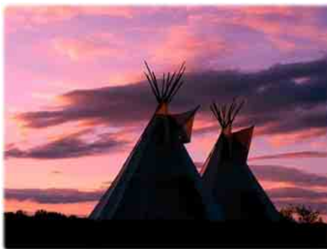
ภาพลักษณะความเป็นอยู่ของชนพื้นเมืองดั้งเดิมในมลรัฐซัสคาตเชวาน

อาจกล่าวได้ว่า ประชากรของประเทศแคนาดาส่วนใหญ่เป็นผู้อพยพย้ายถิ่นมาอาศัยร่วมกับชนพื้นเมืองดั้งเดิม โดยในระยะแรกกลุ่มผู้อพยพจะมาจากประเทศในยุโรป คือ สหราชอาณาจักร และ ฝรั่งเศส จึงเป็นสาเหตุหลักที่ทำให้ประเทศแคนาดามีภาษาราชการ 2 ภาษา คือ ภาษาอังกฤษ และภาษาฝรั่งเศส และปรากฏวัฒนธรรมของสองชาตินี้อย่างชัดเจน ทั้งนี้ ประชากร 3 ใน 4 ของประชากรทั้งประเทศ ใช้ภาษาอังกฤษ และที่เหลืออีก 1 ใน 4 ของจำนวนประชากรจะใช้ภาษาฝรั่งเศส ซึ่งประชากรกลุ่มนี้ส่วนใหญ่อาศัยอยู่ในมลรัฐควิเบค