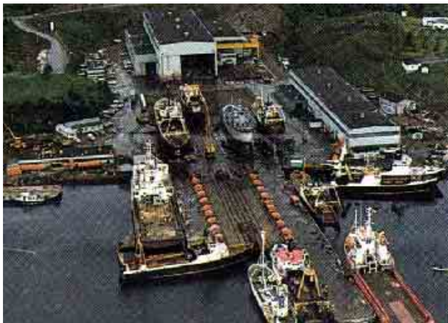
ภาพภูมิประเทศของมลรัฐนิวฟาวด์แลนด์ ซึ่งมีพื้นที่ติดชายฝั่งมหาสมุทรแอตแลนติก(ภาพบน) อุตสาหกรรมที่สำคัญคือ การต่อเรือ(ภาพล่าง)