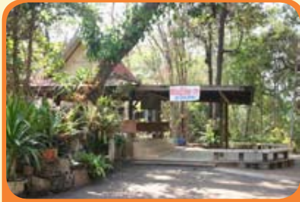
ศาลาฉั้่นน้ำร้อน น้ำชา หลังกวาดใบไม้เสร็จ