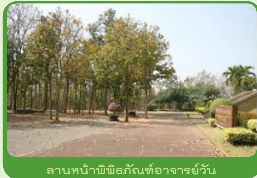
ลานหน้าพิพิธภัณฑ์อาจารย์วัน

วันที่เพื่อนจากอุตรมาเยี่ยมฉัน อาตมายังนึกสงสารไม่หาย พวกเขามาตั้งแต่ สิบโมงเช้า แต่ได้เจออาตมาเกือบบ่ายโมง อย่างที่เคยเล่า ช่วงนี้จะไปเดินจงกรมที่กุฏิ ในป่า ไม่ได้บอกใคร... ไม่มีใครรู้ พวกเขาเที่ยวเดินตามหาอาตมาที่กุฏิในวัดจนถึง พิพิธภัณฑ์ก็ไม่เจอ รอจนเกือบจะกลับกันแล้ว ค่อยเห็นอาตมาเดินลอยชายมาจาก ในป่า