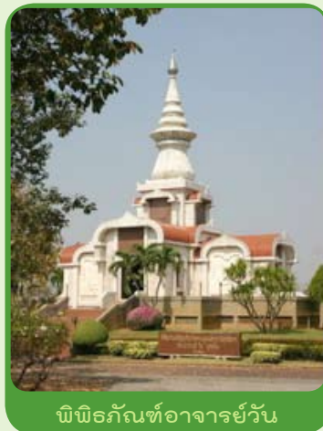
พิพิธภัณฑ์อาจารย์วัน