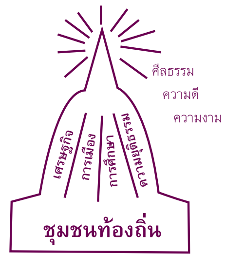
รูปที่ ๓ ชุมชนท้องถิ่นเปรียบประดุจฐานของพระเจดีย์ การพัฒนาทุกชนิดต้องเชื่อมกับฐาน ยอดพระเจดีย์คือศีลธรรม ความดี ความงาม

ฐานของสังคมคือชุมชนท้องถิ่น ชุมชนท้องถิ่นเป็นฐานของการพัฒนาทุกชนิดทั้งประชาธิปไตย เศรษฐกิจ สังคม วัฒนธรรม สิ่งแวดล้อม สุขภาพ ควรวิจัยส่งเสริมให้ชุมชนท้องถิ่นเข้มแข็งทุกด้าน และให้การพัฒนาทุกด้านเชื่อมโยงและเกื้อกูลกันกับความเข้มแข็งของชุมชนท้องถิ่น