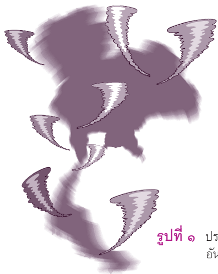
รูปที่ ๑ ประเทศไทยอยู่ในกระแสโลกาภิวัตน์อันเชี่ยวกราก ซึ่งอาจซัดให้เราล้มทั้งยืนได้

คุณภาพต้องมีทั้งภายในตัวเองและกับภายนอก ประเทศไทยตั้งอยู่ในกระแสโลกาภิวัตน์อันเชี่ยวกราก ซึ่งอาจซัดให้ประเทศไทยล้มทั้งยืน นั่นคือเสียคุณภาพอย่างยิ่งและไม่สามารถรักษาความเป็นปรกติสุขได้ การจะรักษาคุณภาพกับโลกได้เราจึงต้องมีความสามารถสูงที่จะเข้าใจโลกและมีสมรรถนะในการเผชิญกับภัยคุกคามในรูปแบบต่าง ๆ