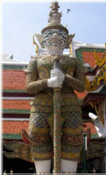
จักรวรรดิ

ลูกเล่ามาถึงยักษ์คู่สุดท้ายแล้วค่ะแม่ อย่าเพิ่งเบื่อที่จะอ่านนะคะ ได้แก่ จักรวรรดิ (กายสีขา) และอัศรกรรมมารา (กายสีม่วงเข้ม)