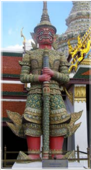
สุริยาภพ

มาเดินชมยักษ์กันเลยดีกว่าค่ะ เริ่มจากทางทิศตะวันออกด้านหน้าพระอุโบสถ เรียงจากทิศเหนือไปใต้ มียักษ์ใหญ่อยู่ ๒ คู่ ๔ ตน ได้แก่ สุริยาภพ (กายสีเขียว) และ อินทรชิต (กายสีเขี้ยว)