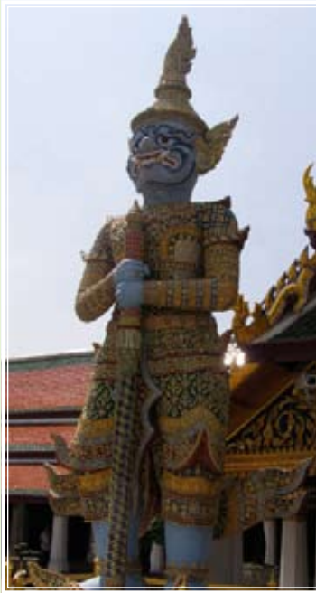
ไมยราพณ์

ทางด้านทิศตะวันตก ข้างหลังพระอุโบสถมียักษ์ถึง ๓ คู่ ๖ ตนค่ะแม่ คู่แรกคือ ไมยราพณ์ (กายสีม่วงอ่อน) และ วิรุณจำบัง (กายสีเขียวเจือดำ)