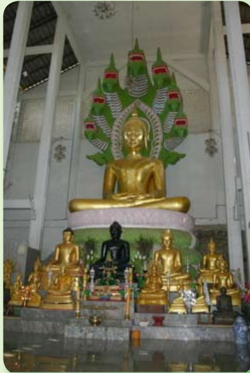
หลวงพ่อมงคลมูจลินทร์