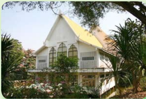
วิหารหลวงพ่อมงคลมุจลินทร์ (มีทางเข้าด้านหน้า)

คืนก่อน (๒๗ ก.ย. ๓๘) ได้ร่วมพิธีพุทธาภิเศก เหริยญหลวงพ่อมงคลมุจลินทร์ทางวัดจัดทำเตรียมไว้สำหรับงานทอดกฐินวันที่ ๒๒ ตุลาคม ๓๘ เป็นพิธีที่โหดมากสำหรับพระใหม่ ที่ต้องมาสวดมนต์ นั่งปรกสมาธิ (ธรรมดานั่งสมาธิไม่ค่อยดีอยู่แล้ว คืนนั้นยังไม่ค่อยได้เรื่องกว่าเดิม)