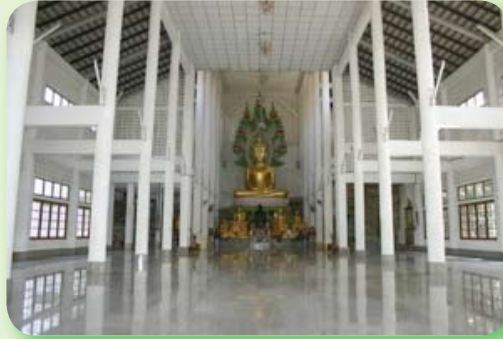
ภายในวิหาร