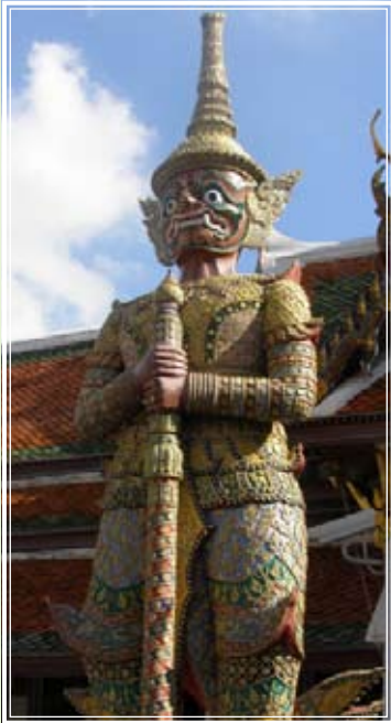
ทศคีรีวัน

แม่คะ ทางทิศใต้ใกล้ ๆ กับหลังพระอุโบสถ ติดกับประตูที่ผ่านเข้าไปในเขต พระราชฐานชั้นกลาง ก็มีสุรู้อีก ๑ คู่ ๒ ตนค่ะ