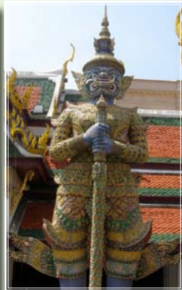
อัศรกรรมมารา