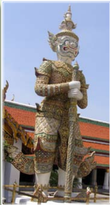
สหัสเดชะ

ทศกัณฐ์ เจ้าเมืองลงกา (คนไทยทั่วไปก็รู้จักกันดีอยู่แล้วนะคะแม่) เป็นลูกชายของท้าวลัสเตียนและพระนางรัชดา มีสิบเศียร ยี่สิบกร มีอิทธิฤทธิ์มาก มีนางอัคคีและนางมณโฑ เป็นนมเหสีเอก ทศกัณฐ์คือยักษ์นนทกกลับชาติมาเกิด เพื่อรบกับ