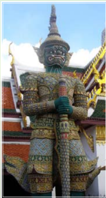
มังกรกัณฐ์

ยักษ์คู่ต่อมาก็คือ มังกรกัณฐ์ (กายสีเขียว) และวิรุพหก (กายสีขาบหรือสีน้ำเงินเข้ม)