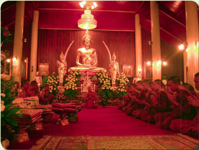
พระพุทธพิชิตมาร มัชฌิมพุทธกาล ภายในศาลาอรุณวงศ์

เล่ามาถึงตรงนี้ก็เห็นถึงความสำคัญของวัดกับพระกรรมฐานสายหลวงปู่มั่น ด้วยเหตุนี้จึงมีพระฝ่ายปฏิบัติมาแวะเวียนพักอาศัย เรื่อยมาจากในอดีตจนถึงปัจจุบัน ลองมาเดินตามวิหารลานพระเจดีย์ไปด้วยกันนะครับ