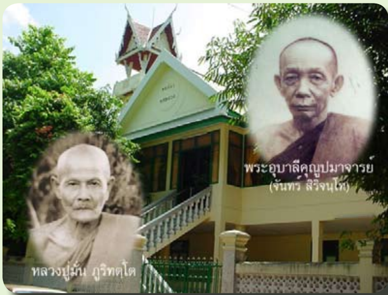
หอเชียว ที่พำนักท่านเจ้าคุณพระอุบาลีฯ

ที่แห่งนี้เปิดต้อนรับนักท่องเที่ยวตลอดเวลา ศาลาแห่งนี้ทำหน้าที่เป็นศาลาการเปรียญสำหรับพระลงมาสวดมนต์ทำวัตรเช้าเย็น ฟังธรรมในวันพระและบำเพ็ญบุญต่างๆ พระประธานในศาลา คือ “พระพุทธรูปชิตมาร มัชฌิมพุทธรูป” เป็นพระพุทธรูปที่ท่านเจ้าคุณพระอุบาลีฯ บูรณะจากพระพุทธรูปเก่าสมัยอยุธยา นอกจากนี้ก็มีรูปหล่อขนาดเท่าองค์จริงของพระบูรพาจารย์องค์สำคัญของวัด ๒ รูป คือ ท่านเจ้าคุณพระอุบาลีฯ กับท่านเจ้าประคุณสมเด็จพระมหาวิรรวงศ์ กราบพระเสร็จลงมองบนยกพื้นพรมสีแดง จะเห็นธรรมาสน์อันงดงาม ธรรมาสน์อันนี้แหละเมื่อครั้งที่หลวงปู่มั่นลงมาจำพรรษาที่วัดปทุมวนาราม กรุงเทพฯ ท่านได้เดินทางมาฟังพระธรรมเทศนาจากท่านเจ้าคุณพระอุบาลีฯ ตลอดจนการทำวัตรสวดมนต์ทุกวันธรรมสวันะ ในศาลาบนธรรมาสน์อันนี้เอง