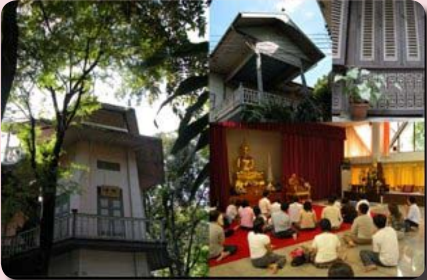
(ซ้าย) หอมราภิรมย์ (บนขวา) กุฎีปัทมราช (ล่างขวา) กิจกรรมศูนย์อบรมภาวนาสิริจันโท