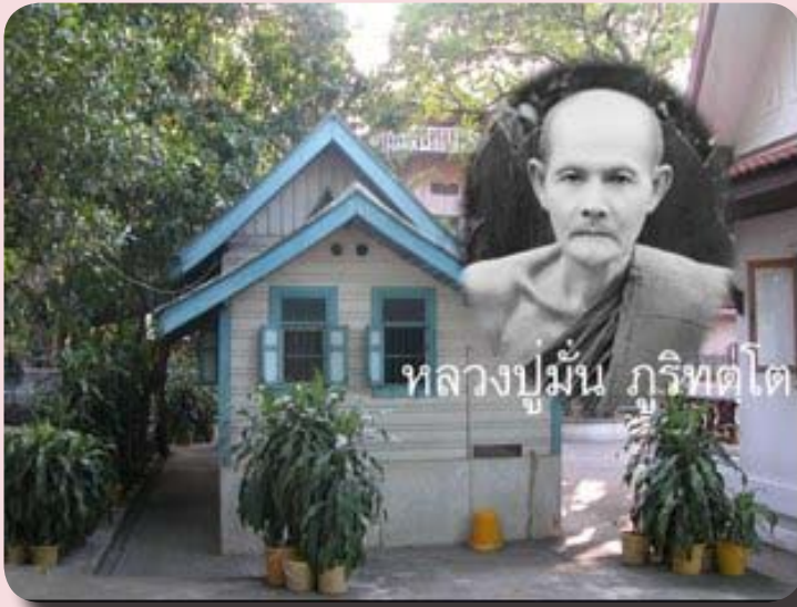
กุฏิไม้หลังเล็ก เคยเป็นที่พำนักของ หลวงปู่มั่น ฐิริทัตโต

ที่ ๓ ของเดือน และการถือศีลอบรมภาวนาในวันสำคัญทางพระพุทธศาสนา เป็นอีกหนึ่งแรงที่จะดำรงไว้ซึ่งการปฏิบัติธรรมให้ยังดำรงอยู่ในวัดนี้