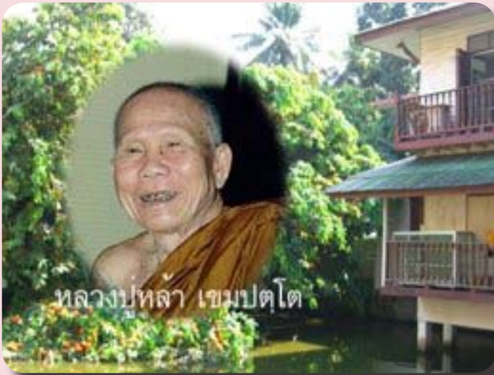
กุฏิบ่อเต่า เคยเป็นที่พำนักของ หลวงปู่หล้า เขมปัตโต

เปิดพระอุโบสถให้ มีเกิร์ตอีกชนิดหนึ่งถ้าเข้ามาในเขตพระอุโบสถแล้ว ลองสังเกตดูดี ดีแปดเขียนอธินหารมีจริง!