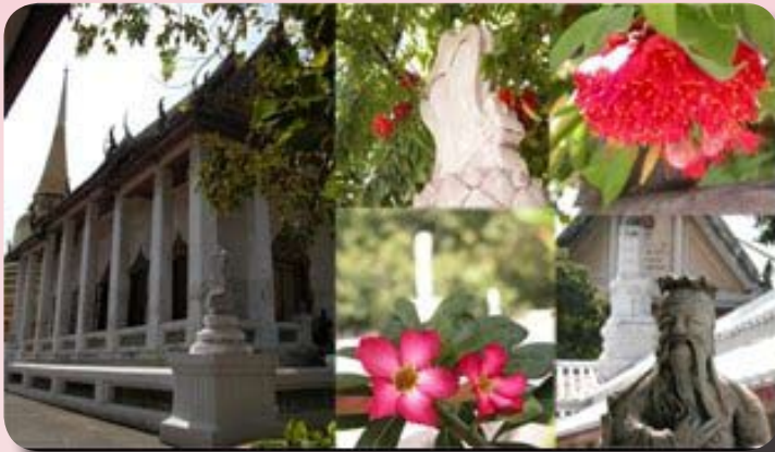
พระอุโบสถ วัดบรมนิวาส

ในฉบับที่แล้ว ผู้เขียนได้กล่าวถึงประวัติและความสำคัญของวัดบรมนิวาสโดยย่อ และได้พาชมสถานที่บางส่วนของวัด ในฉบับนี้ ผู้เขียนขออนุญาตพาชมวัดบรมนิวาสต่อไป