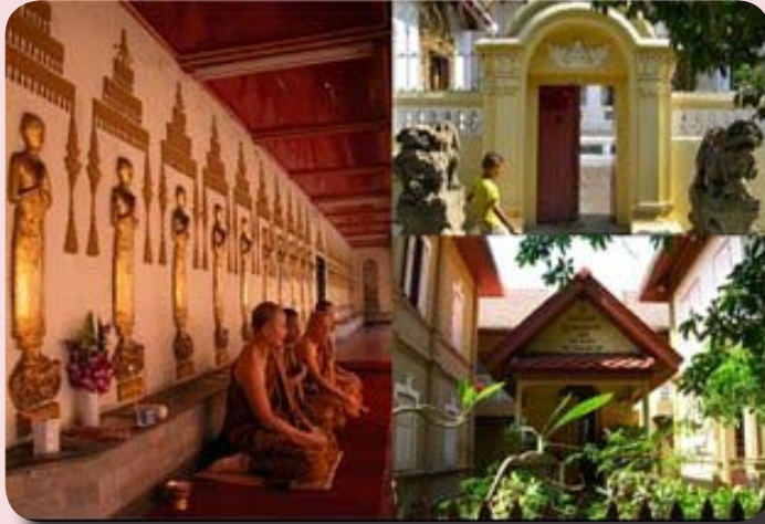
(ซ้าย) ภายในพระวิหารรายมีพระอริยมหาสาวก ๘๐ รูป (ขวา) กุฎิกรรมฐาน

พระเจดีย์ เป็นที่ประดิษฐานรูปปูนปั้นนูนต่ำพระอริยมหาสาวก ๘๐ รูปในอิริยาบถ ยืนนมัสการพระเจดีย์ ยังมีผู้สังเกตเห็นว่า พระสาวกเหล่านี้กำลังเดินจงกรมแสดงถึงจุด ประสงค์ของวัดที่เป็นวัดฝ่ายปฏิบัติ บริเวณด้านหน้าพระสาวกเหล่านี้ ก็ยังเหมาะสม กับการเดินจงกรมอีกด้วย