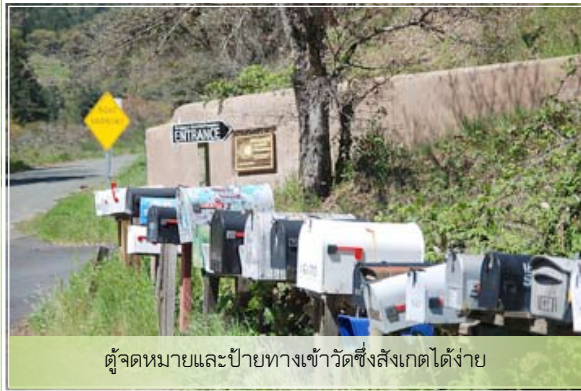
ตู้จดหมายและป้ายทางเข้าวัดซึ่งสังเกตได้ง่าย

หลังจากขับรถเข้ามาได้ระยะทางหนึ่ง จุดสังเกตทางเข้าวัดที่ถือว่าเป็น จุดสังเกต หรือ Landmark อย่างหนึ่งคือ มีตู้รับจดหมายเรียงรายอยู่เกือบ 20 ตู้! ดังนั้นใครที่ไม่เคยมาวัด ไม่ต้องกลัวเลยว่าจะเลี้ยวผิดทาง