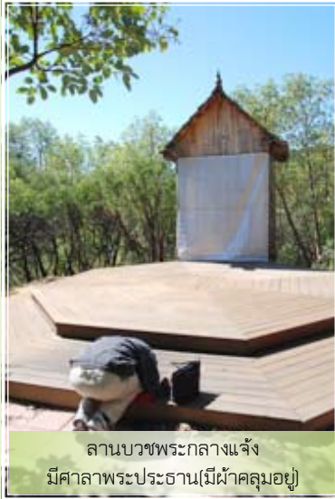
ลานบวชพระกลางแจ้ง มีศาลาพระประธาน(มีผ้าคลุมอยู่)