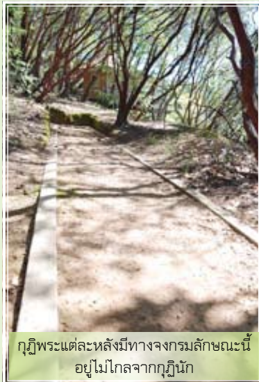
กุฏิพระแต่ละหลังมีทางจงกรมลักษณะนี้ อยู่ไม่ไกลจากกุฏินัก