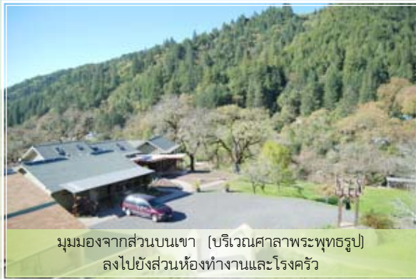
มุมมองจากส่วนบนเขา (บริเวณศาลาพระพุทธรูป) ลงไปยังส่วนห้องทำงานและโรงครัว