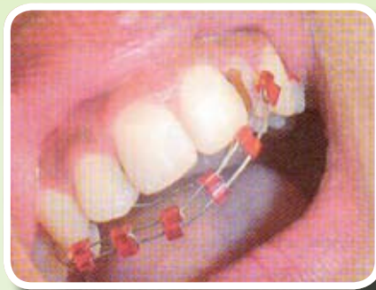
ลวดเหล็ก

หนูเห็นเค้ามั้งโต๊ะรับจัดฟันแพชั่นด้วยนะคะ