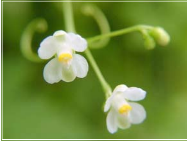
ภาพดอกโคกกระออม

จาก http://farm1.static.flickr.com/85/245679588_e072735ffa.jpg?v=0