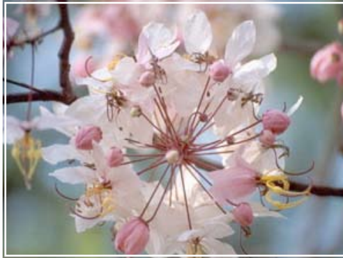
ภาพดอกกัลปพฤกษ์

ปรับปรุงจาก http://home.kku.ac.th/info/photo_01/mview_009.jpg