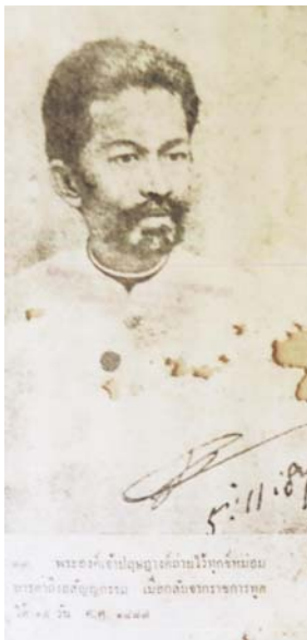
พระรูปพระองค์เจ้าปฤศตวงศ์ที่เก็บรักษาไว้ที่วัดอภินิหาราม นอกเมืองโคลัมโบ

วัดที่พระองค์เจ้าปฤศตวงศ์เป็นเจ้าอาวาสอยู่นี้ พระบาทสมเด็จพระเจ้าอยู่หัวอานันทมหิดลก็เคยเสด็จไปเยือนและปลูกไม้จันทน์แดงไว้เป็นที่ระลึก เมื่อ ๒๕ มกราคม พ.ศ. ๒๔๘๒ ในขณะที่พระบาทสมเด็จพระเจ้าอยู่หัวในรัชกาลปัจจุบันก็เคยเสด็จและปลูกต้นไม้ไว้เป็นที่ระลึกเช่นกัน เมื่อ ๑๕ มีนาคม ๒๔๙๓ และท้ายสุด เจ้าฟ้าจุฬาภรณีก์เสด็จมาปลูกไม้จันทน์เช่นกัน เมื่อ ๒๘ สิงหาคม ๒๕๕๒