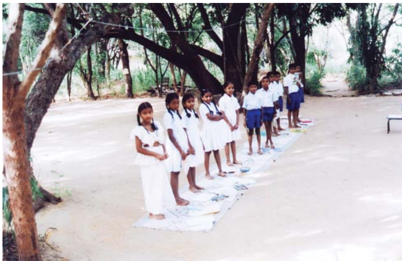
เมื่อเห็นภิกษุณี เด็กนักเรียนแสดงความเคารพโดยลุกขึ้นต้อนรับ

หลานที่เข้าโรงเรียนพุทธศาสนาวันอาทิตย์ที่นั่นด้วย การมาวัดในเช้าวันอาทิตย์จึงเป็นกิจกรรมของสมาชิกในครอบครัวร่วมกัน สนับสนุนซึ่งกันและกัน