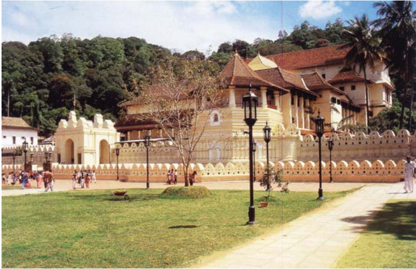
พระวิหารพระเขี้ยวแก้วในเมืองแคนดี้

ผู้ชายที่เป็นคนตีกลองจะแต่งตัวที่มีสีสันทัน ใส่โจงกระเบนขาว เปลือยอก แต่มีเครื่องประดับสีแดงและสีทอง มีผ้าโพกผมแบบแขก คนที่เป็นมือกลองนำ จะต้องมีการแสดงประกอบไปด้วย ขณะเดินนำ กล่าวคือ มีการตีลังกาเป็นทอดๆ ได้รับเสียงปรบมือให้ร้องต้อนรับจากผู้ที่ยืนรอชมขบวนแห่เป็นระยะๆ ไม่ขาดสาย