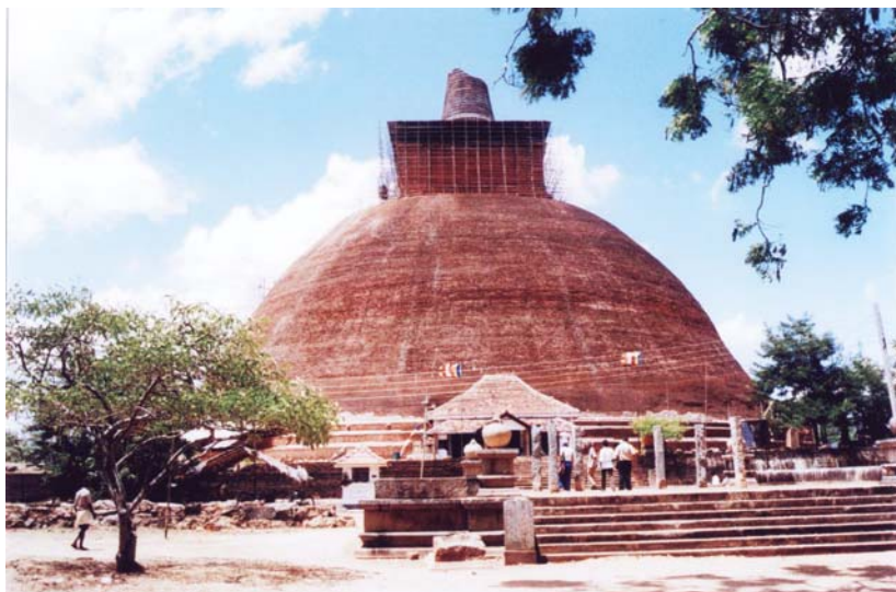
พระสถูปที่เมืองหลวงเก่า อนุราธปุระ

วัฒนธรรมและโดยเฉพาะศาสนาด้วย ดังที่เราได้พบหลักฐานการสืบพระศาสนาของพระภิกษุณีสงฆ์จากศรีลังกาไปประเทศจีน ก็โดยผ่านความช่วยเหลือของพ่อค้าวานิชที่เดินทางค้าขายติดต่อกันระหว่างศรีลังกากับประเทศจีนนั่นเอง