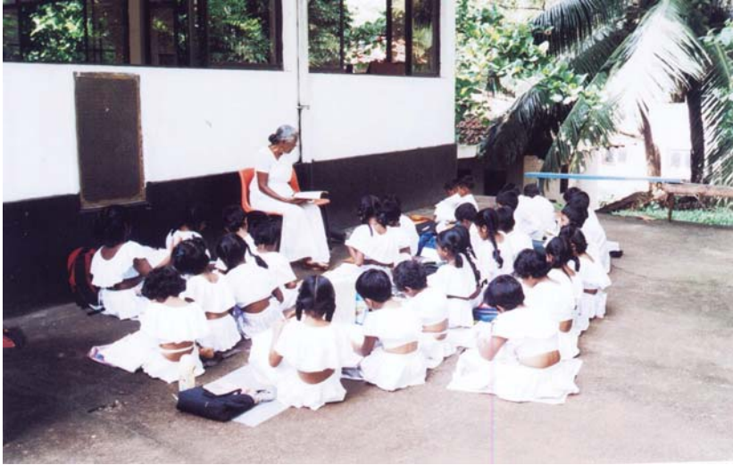
ชั้นเรียนเด็กเล็กในโรงเรียนวันอาทิตย์วัดเกลณียะ เมืองโคลอมโบ

โรงเรียนพระพุทศศาสนาวันอาทิตย์มีเวลาเรียนครึ่งวัน คือ ๘.๓๐ น. ถึง ๑๒.๐๐ น. ทุกวันอาทิตย์ก่อนเข้าเรียน พระภิกษุ หรือภิกษุณี (ขึ้นอยู่กับว่าโรงเรียนนั้นตั้งอยู่ในวัดของภิกษุหรือภิกษุณี) จะเป็นผู้นำเด็กนักเรียนทั้งชายและหญิงประกอบพิธีทางศาสนา โดยฝึกให้เด็กรู้จักการสมาทานศีล ๕ สอนให้เด็กกล่าวคำบูชาพระรัตนตรัย รู้จักสวดมนต์ สรรเสริญพระพุทศคุณ พระอัมมคุณ พระสังฆคุณ แล้วจึงแยกย้ายกระจายไปเข้าห้องเรียนของตน