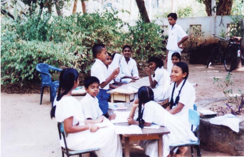
ชั้นเรียนโรงเรียนวันอาทิตย์ที่ศูนย์ฝึกอบรมภิกษุณี กลอนแดวะ เมืองดัมบุลลา

ได้มีการพูดคุยกันอย่างไม่เป็นทางการว่า ครูที่มาเป็นอาสาสมัครในโรงเรียนสอนพุทธศาสนาวันอาทิตย์ควรจะได้รับความช่วยเหลือในเรื่องค่าใช้จ่าย อย่างน้อยที่สุดก็เป็นค่าเดินทาง ครูสตรีที่ได้ให้ข้อมูลแล้วว่าเธอมีค่าใช้จ่ายคือค่ารถสามล้อเที่ยวละ ๔๐ รูปี ไปกลับ ๘๐ รูปี เธอต้องออกค่าใช้จ่ายเองทั้งสิ้น แต่จากการสัมภาษณ์ปลัดกระทรวงพระพุทธศาสนา นายอภัยวิกรม มีความเห็นว่า อาสาสมัครก็เป็นอาสาสมัคร นั่นคือจะไม่ได้ค่าตอบแทน แต่ในความเป็นจริงรัฐบาลคงไม่มีงบประมาณหรือมิได้จัดลำดับความสำคัญของการจัดสรรงบประมาณให้