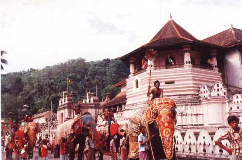
พิธีแห่พระเขี้ยวแก้วประจำปี

อนุญาตให้พระองค์จับพระธาตุ ถือเป็นการลบล้างเกียรติ จึงไม่เสด็จออกทอดพระเนตรพิธีดังกล่าว แม้กระนั้น ก็ยังเสด็จไปศรีลังกาอีก ถึง ๓ ครั้ง ครั้งสุดท้ายเดือนพฤศจิกายน ๒๕๕๐