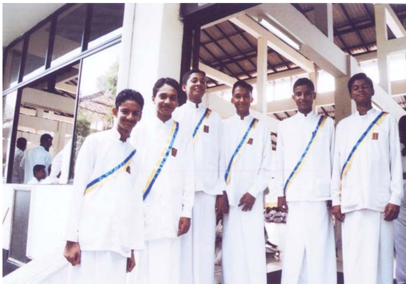
กลุ่มเด็กชายวัยรุ่นที่โรงเรียนวันอาทิตย์ภาคภูมิเฝ้ากับสายสะพายสีน้ำเงินเหลือง

การให้เกียรติและยกย่องให้ปรากฏนั้น ทำในหลายรูปแบบ เช่น นักเรียนรุ่นพี่จะได้รับการมอบหมายให้ดูแลรุ่นเล็ก เป็นขั้นเป็นชั้นไป โดยรุ่นโตที่สุดที่มีหน้าที่ดูแลความเรียบร้อยของน้อง ๆ จะใส่แถบสามสี สีแดง น้ำเงิน และเหลือง ชั้นรองลงไปมีแถบสองสี สีน้ำเงิน และเหลือง และชั้นต่ำสุดใส่แถบสีเดียว คือสีเหลือง เช่นนี้เป็นต้น นักเรียนรุ่นพี่ที่ได้รับเลือกให้ใส่แถบนี้ นอกเหนือจากภาระหน้าที่ให้ดูแลรุ่นน้องแล้ว ยังต้องทำตัวเป็นตัวอย่าง รักษาวินัย รักษาความเรียบร้อยของตนเอง ตั้งแต่การแต่งตัวสะอาด พุดจาไพเราะ มีสัมมาคารวะ รู้จักที่ต่ำที่สูง เป็นตัวแทนของรุ่นน้องในโอกาสต่างๆ เป็นต้น เป็นการสร้างบุคลิกภาพ โดยการหล่อหลอมโดยการปลูกฝังมาจากโรงเรียนพระพุทธศาสนาวันอาทิตย์นี้เอง