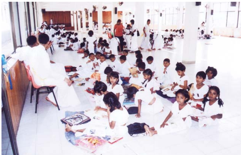
ลักษณะชั้นเรียนโรงเรียนวันอาทิตย์ที่วัดเกลณียะ

ที่วัดเกลณียะ มีบิดามารดาและผู้ปกครองหลายคนที่มาส่งบุตรหลานเข้าเรียนแล้วถือโอกาสสวดมนต์ รดน้ำต้นโพธิ์ ทำสมาธิ จนได้เวลารับลูกหลานกลับบ้านพร้อมกัน