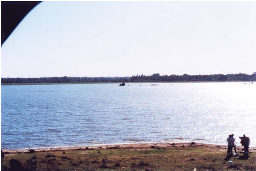
แควะ หรืออ่างเก็บน้ำขนาดใหญ่ในศรีลังกา

ในการจัดการระบบน้ำดังกล่าวประชาชนเองเข้ามามีส่วนร่วมในการเกณฑ์แรงงานเพื่อจัดวางระบบการส่งน้ำเข้าสู่หมู่บ้านของตน เพื่อประโยชน์ของตนเอง