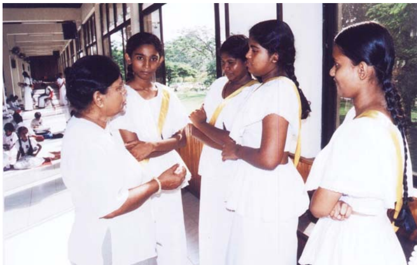
ชั้นเรียนเด็กเล็กในโรงเรียนวันอาทิตย์วัดเกลณียะ เมืองโคลอมโบ