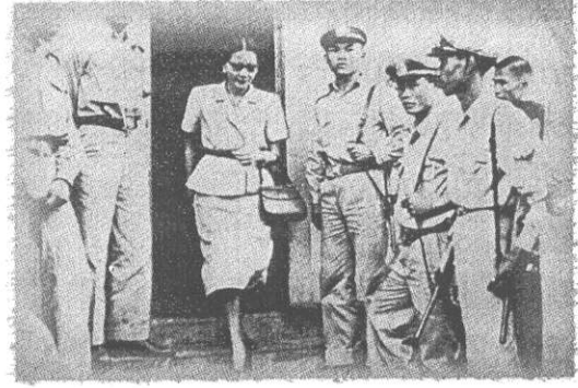
ขณะเดินออกจากห้องพิจารณาคดีศาลอาญา เพื่อขออำนาจฝากขัง

ท่านผู้หญิงพูนศุข เขียนไว้หลังรูปว่า: รูปประวัติศาสตร์ ถ่ายโดยน.ส.พ. เมื่อวันที่ ๒๑ พฤศจิกายน พ.ศ. ๒๔๙๕ อายุ ๔๐ ปี ๑๐ เดือน ๑๙ วัน ข้อหากบฏภายในและภายนอกราชอาณาจักร