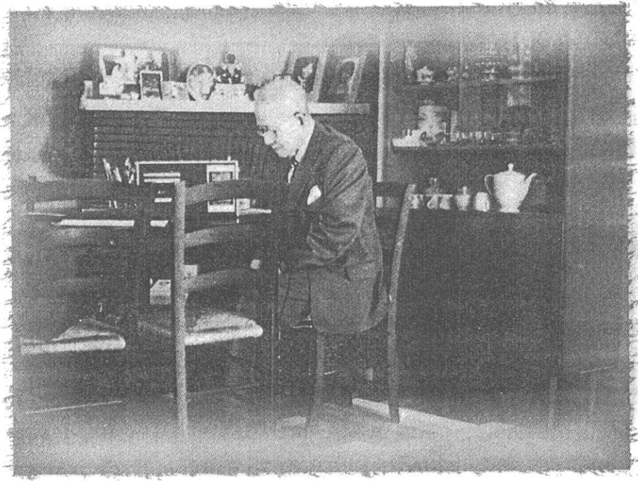
ในบ้านปลายชีวิตของนายปรีดี พนมยงค์ ที่บ้านพัก Antony ประเทศฝรั่งเศส

หลังจากที่ท่านรัฐบุรุษอาวุโส ปรีดี พนมยงค์ ได้ออกจากสาธารณรัฐประชาชนจีนไปพำนักอยู่ ณ กรุงปารีสประเทศฝรั่งเศส แต่เดือนพฤษภาคม พ.ศ. ๒๕๑๓ เป็นต้นมา ปรากฏว่า ณ บ้านพักของท่านรัฐบุรุษอาวุโส เลขที่ ๑๗๓ ซึ่งอยู่ที่แขวงองตอว์นี ถนนอาร์ สตีตบริองค์ ได้กลายเป็นสถานที่ที่ดึงดูดความสนใจของคนไทยทั้งหลายที่ผ่านกรุงปารีส ให้ใครได้ไปเยี่ยมชมของท่านเจ้าของบังกาโลชั้นครึ่งหลังนั้นที่ปลูกอยู่ในเนื้อที่ประมาณ ๘๐ ตารางวา