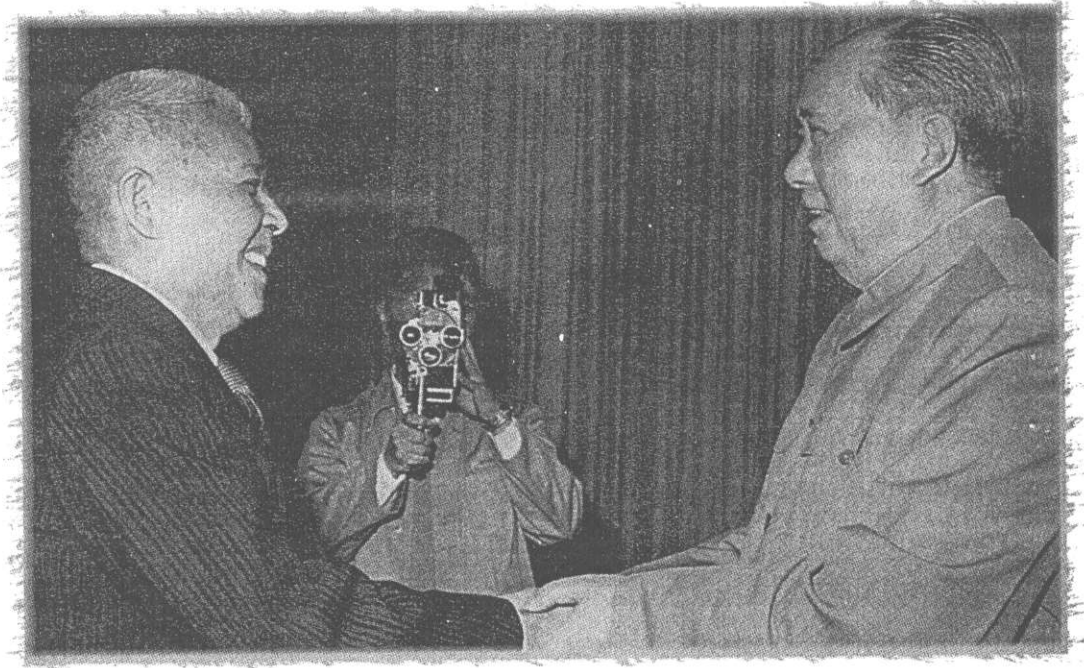
ท่านปรีดี พนมยงค์ เข้าเยี่ยมคำนับ ประธานเหมาเจ๋อตง ที่กรุงปักกิ่ง พ.ศ.๒๕๐๘

เขาเห็นใจผมที่จากบ้านเมืองมา ๒๐ ปีเศษ แม้แต่ท่านประธานเหมาเองเคยถามผมว่า ไม่คิดถึงบ้านบ้างเลยหรือ เห็นจากบ้านเมืองมานาน ตัวท่านเองได้รับเชิญไปเยือนโซเวียตเพียง ๓ เดือน คิดถึงบ้านใจแทบขาด ผมตอบว่า คิดถึง ครั้นเมื่องานวันชาติจีนใหม่ ผมได้รับเชิญไปร่วมในงานด้วย พบนายกรัฐมนตรีโจว เอินไหล ท่านถามว่า ผมอยากจะไปเที่ยวไหนบ้าง ผมตอบว่า ผมท่องเที่ยวไปทั่วประเทศจีนรวมทั้งเขตที่คนเผ่าไทยอยู่ด้วย ผมจึงอยากจะไปสแกนดิเนเวีย เพราะไม่เคยไป หากจะไปอยู่ปารีสได้ก็จะเป็นการดี จะได้มีโอกาสพบครูบาอาจารย์และมิตรสหายที่ร่วมสำนักเดียวกันมา เพราะเหตุนี้แหละครับที่ผมออกเดินทางมาพำนักในประเทศฝรั่งเศส”