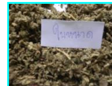
8. ใบหนาด จำนวน 1 หยิบมือ