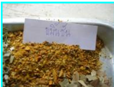
4. ขมิ้นชัน จำนวน 1 ชีด