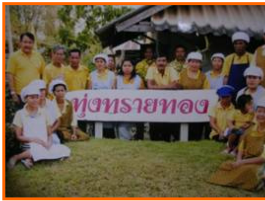
สมาชิกภายในกลุ่มสมุนไพรทุ่งทรายทอง