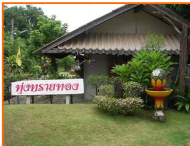
สถานที่ตั้งกลุ่มสมุนไพรไทยทุ่งทรายทอง

วิสาหกิจชุมชนกลุ่มสมุนไพรไทยทุ่งทรายทอง ตั้งอยู่บ้านเลขที่ 477 หมู่ที่ 9 ตำบลหนองพะยอม อำเภอดงพานหิน จังหวัดพิจิตร เป็นกลุ่มจัดตั้งขึ้นเพื่อปลูกและแปรรูปสมุนไพร โดยการรวมกลุ่มของชาวบ้าน ประมาณ 16 คน ได้ร่วมกันลงทุนและแปรรูปสมุนไพรตั้งแต่ปีพ.ศ. 2544 และวิสาหกิจชุมชนกลุ่มสมุนไพรไทยทุ่งทรายทองได้รับการจดทะเบียนเป็นวิสาหกิจชุมชนตามพระราชบัญญัติส่งเสริมวิสาหกิจชุมชน พ.ศ. 2548 ตั้งแต่วันที่ 11 พฤศจิกายน 2548 โดยได้รับการช่วยเหลือจากหน่วยงานภาครัฐต่างๆ เช่น สำนักงานพัฒนาชุมชน จังหวัดพิจิตร สำนักงานอุตสาหกรรมจังหวัดพิจิตร จนผลิตภัณฑ์ของกลุ่มได้รับอนุญาตให้แสดงเครื่องหมายมาตรฐานผลิตภัณฑ์ชุมชน จากสำนักงานมาตรฐานผลิตภัณฑ์อุตสาหกรรม มาตรฐานเลขที่ มพช. 176/2546 และได้รับการจดทะเบียนเครื่องหมายการค้า “สมุนไพรทุ่งทรายทอง” จากสำนักเครื่องหมายการค้า กรมทรัพย์สินทางปัญญา ตั้งแต่วันที่ 23 กันยายน พ.ศ. 2548