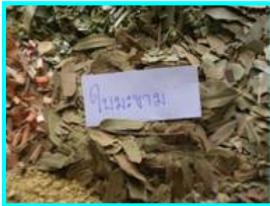
1. ใบมะขาม จำนวน 1 หยิบมือ