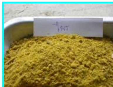
5. ไพล จำนวน 4 ชีด