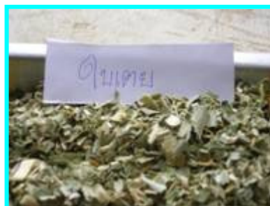
7. ใบเตย จำนวน 1 หยิบมือ