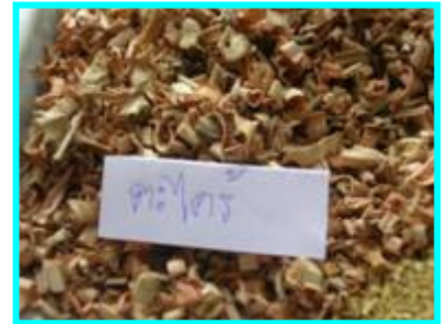
3. ตะไคร้ จำนวน 3 ชีด