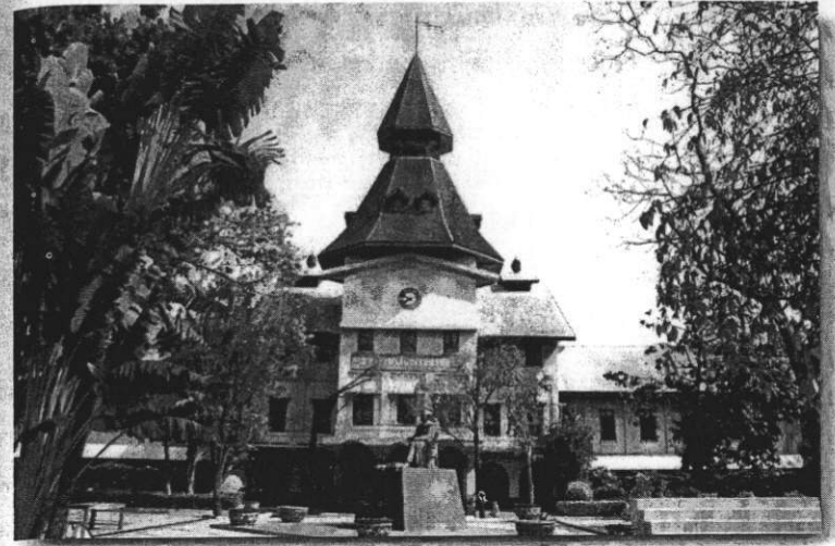
มหาวิทยาลัยธรรมศาสตร์