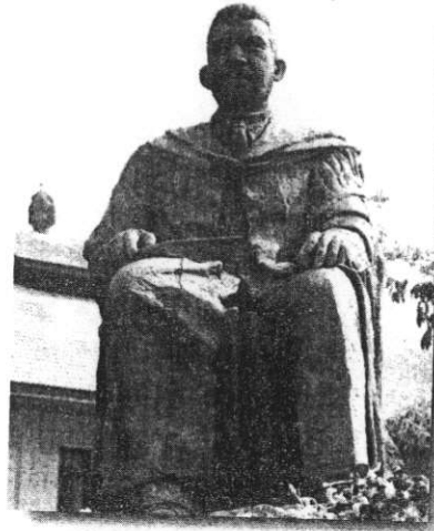
อนุสาวรีย์ท่านปรีดี พนมยงค์ ณ มหาวิทยาลัยธรรมศาสตร์

ในวันที่ ๒๗ มิถุนายน พ.ศ. ๒๕๔๑ มีพิธีเปิดหอสมุดปรีดี พนมยงค์ ภายในมหาวิทยาลัยธรรมศาสตร์