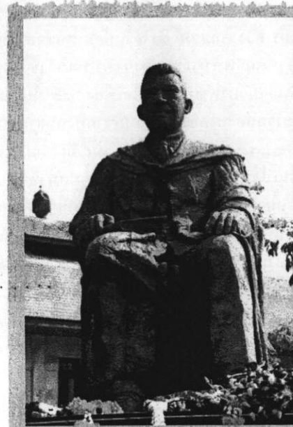
อนุสาวรีย์ท่านปรีดี พนมยงค์ ณ มหาวิทยาลัยธรรมศาสตร์